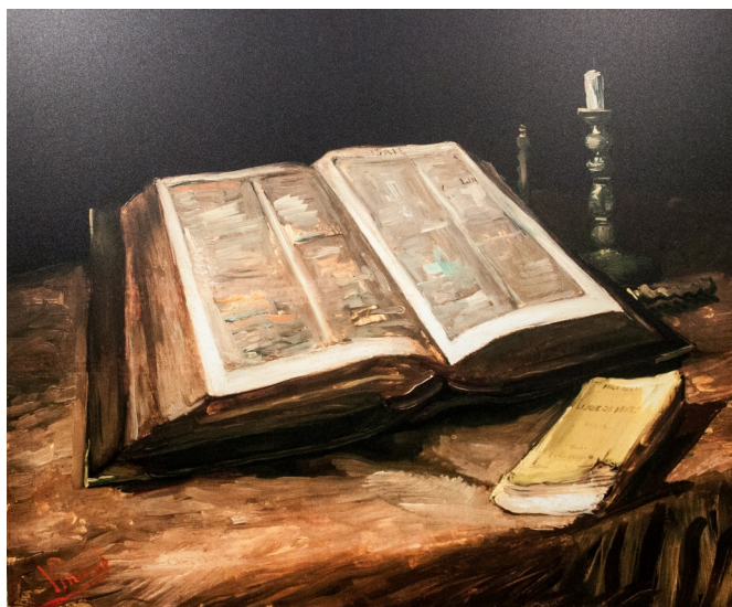
Van Gogh – La Bible

Rejoindre l'église pour lire avec eux la Bible.